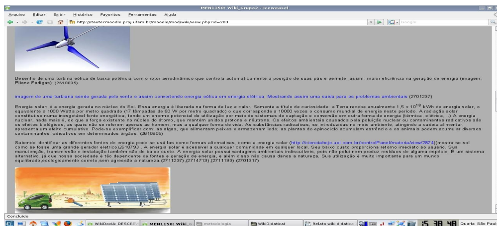
Figura1. wiki com figuras e links produzido pelos alunos

Depois deste direcionamento, os resultados foram bem positivos, conforme mostra a figura 1 a seguir, com parte da produção do wiki e com inserção de figuras, links a outras páginas web com simulações e animações, todas relacionadas a produção conceitual do wiki do Moodle. Cabe destacar que esta é apenas um recorte da produção colaborativa e que outras figuras e links foram adicionadas ao hipertexto.