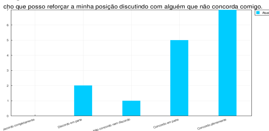
Gráfico 1: referente a questão nº 7

O objetivo principal deste survey foi pesquisar sobre as condutas dos participantes do curso perante a aprendizagem e a reflexão crítica na atividade wiki do Moodle. Cada questão problematizou as condutas e atitudes que os alunos podem ter assumido ao longo do curso, em especial nas atividades wiki. A maioria dos alunos respondeu que concorda plenamente e concorda em parte em relação as questões de condutas colaborativas no processo de ensino-aprendizagem, conforme mostram os gráficos a seguir: